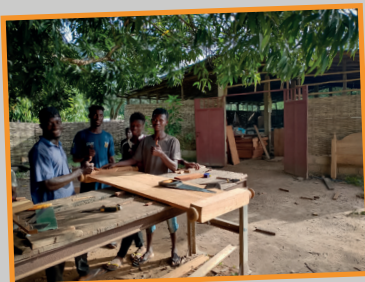
Jongeren aan het werk in de timmerwerkplaats