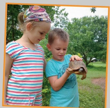
Kijk eens dit is de tartaruga!