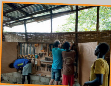
Werken aan het gereedschapsbord