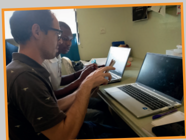
Overzicht creëren in de financiën van de timmerwerkplaats