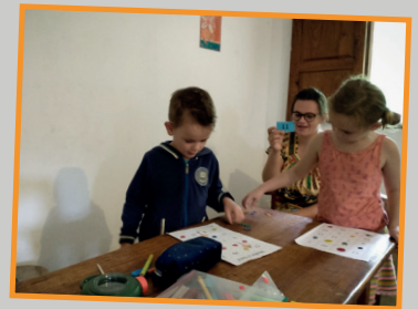
Op school met juf mama