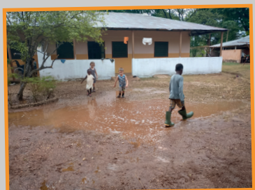
Lekker rennen en dansen in de regen!